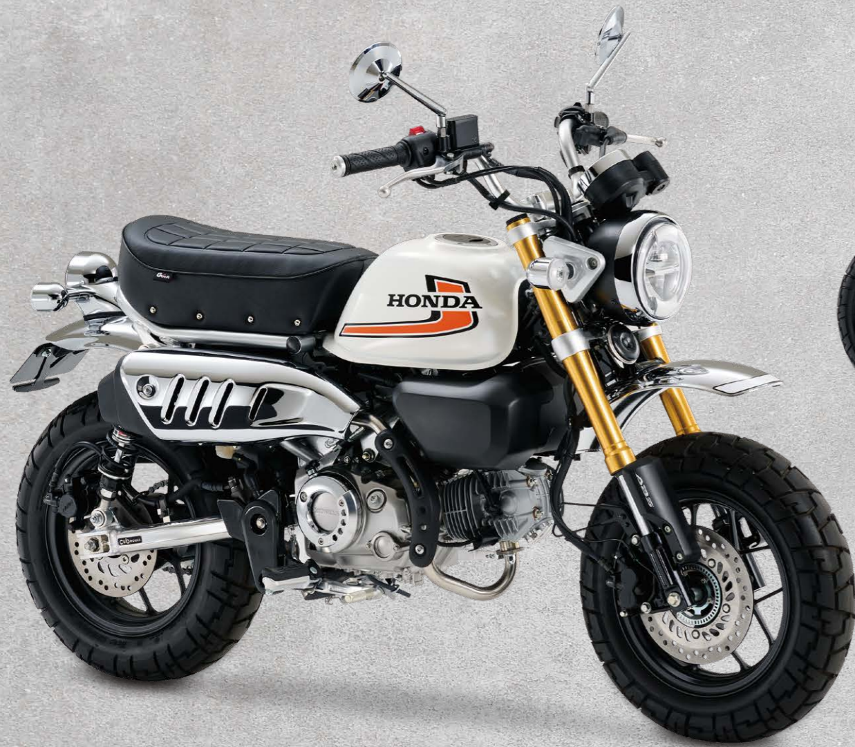
Photo: Cub HOUSE オリジナル カスタマイズパーツ装着車 ※写真は試作品を装着したものです。実際の商品とは異なる場合があります。